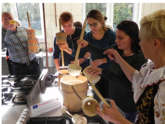
Warsztaty w inkubatorze kuchennym

Wypracowane relacje między członkami LGD są oparte na pogłębionym partnerstwie i skutecznej komunikacji. Zarówno w składzie Zarządu jak i Rady – organu decyzyjnego LGD reprezentowane są wszystkie sektory jak i społeczności gminne tworzące LGD. Składy te są od wielu lat akceptowane przez członków LGD, o czym świadczy ich ograniczona zmienność. Sprzyja temu efektywność działań obu ciał LGD - o czym świadczą dobre wyniki realizacji LSR LGD na przestrzeni ponad 15 lat. Wyniki te nie były by możliwe, bez skutecznej komunikacji. Obok standardowych narzędzi i kanałów (e-maile, informacje na stronie www, telefony), obejmuje ona liczne bezpośrednie kontakty członków Zarządu, Rady i pracowników Biura LGD nie tylko z członkami stowarzyszenia, ale też z lokalnymi społecznościami obszaru LGD. Są one realizowane między innymi przez uczestnictwo przedstawicieli tych ciał w lokalnych imprezach (z wykorzystaniem namiotu i stoiska LGD), organizację tematycznych wyjazdów studyjnych dla zainteresowanych mieszkańców), ale przede wszystkim – przez zorientowanie działań LGD AKTYWNI RAZEM na potrzeby lokalnych społeczności – realizację projektów grantowych, których liczba (22), pomimo ich olbrzymiej pracochłonności, jest udziałem tylko nielicznych polskich LGD.