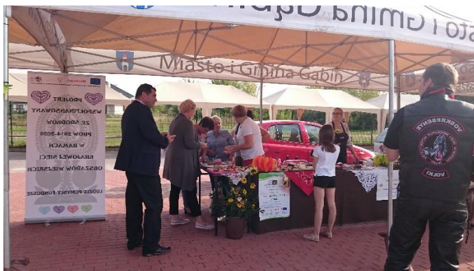
Kiermasz produktów lokalnych (wymienić na nasze stoisko)

Statut Stowarzyszenia potwierdza inkluzywny charakter działalności stowarzyszenia, zapewnia możliwość ciągłego rozszerzania składu o nowe grupy interesów, środowisk społecznych i zawodowych oraz poszerzenia reprezentacji