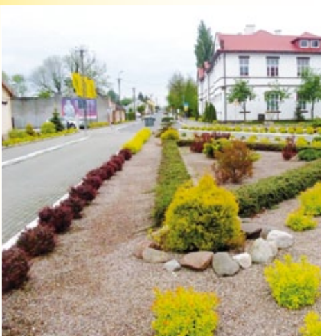
Zieleń miejska i budynki Zespołu Szkół Centrum Kształcenia Rolniczego w Kowalu

Dla kultury miasta ważna jest działalność Towarzystwa Miłośników Kowala i Okolic im. Kazimierza Wielkiego. Życie kulturalne skupia