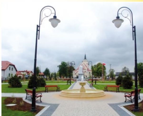
Park im. Kazimierza Wielkiego w Kowalu

się wokół zmodernizowanej w 2005 r. biblioteki miejskiej, szkół, DPS-u w ramach, którego funkcjonują grupy teatralne: Szok i Niepokorni, a przede wszystkim wokół remizy OSP, która pełni funkcję