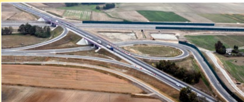
Węzeł autostrady A1 noszący nazwę Kowal