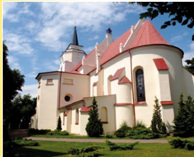
Kościół parafialny pw. św. Urszuli w Kowalu

Z wizerunkiem Kowala nierozdzielnie związany jest także kościół parafialny pw. św. Urszuli, którego początki sięgają XIV wieku. W ciągu ostatnich kilkunastu lat świątynia została gruntownie odnowiona poprzez: nowe pokrycie dachu i wieży kościelnej, nowe tynki, odrestaurowanie plebanii, wybudowanie w 1995 roku dzwonnicy, na której zamontowano trzy dzwony, w tym jeden nowy, noszący imię Jana Pawła II.