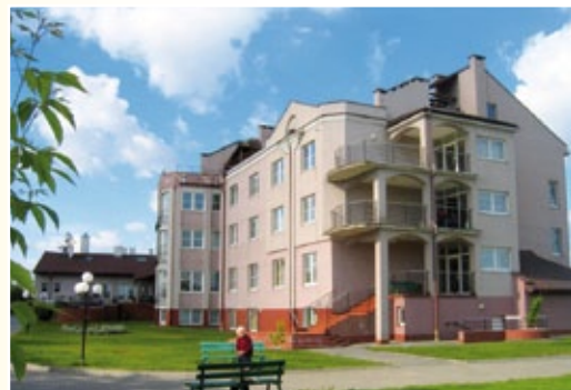
Dom Pomocy Społecznej

Po upadku komunizmu miasto stało się centrum usługowo - handlowym dla okolicy. W czasie minionych 20 lat stworzono od podstaw system kanalizacji, wraz z oczyszczalnią ścieków, zmodernizowano wszystkie ulice, których ilość zwiększyła się z 31 do 48. O ponad 30 % wzrosła liczba domów, co stało się głównie za sprawą chętnie osiedlających się w Kowalu nowych mieszkańców. Na te inne polskie miast Kowal wyróżnia się dbałością o zieleń, czystość, ład i porządek. Znajdują się w nim: przedszkole, szkoła podstawowa, gimnazjum, liceum ogólnokształcące i zespół szkół rolniczych, trzy placówki służby zdrowia, stacja pogotowia ratunkowego oraz Dom Pomocy Społecznej dla osób cierpiących na stwardnienie rozsiane.