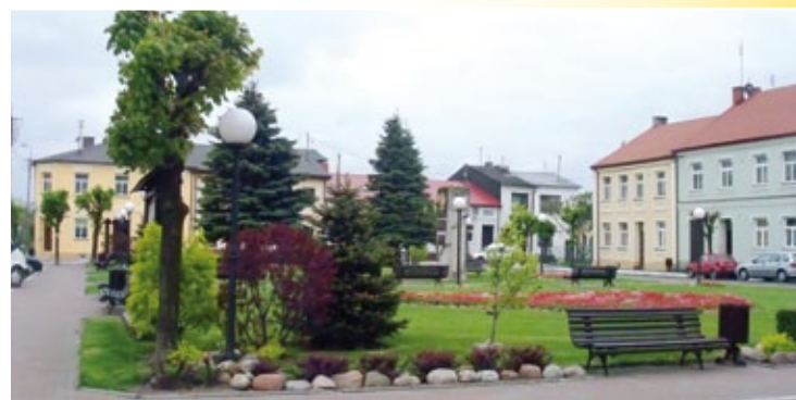
Plac Rejtana w Kowalu

W mieście znajdują się też: bank, zakłady przemysłu metalowego, stolarskie i duża firma produkująca szyby do okien. Funkcjonują tu także: posterunek policji oraz publiczne służby w zakresie drogownictwa, telekomunikacji i energii elektrycznej. Miasto jest otwarte i przyjazne nowym mieszkańcom i inwestorom.