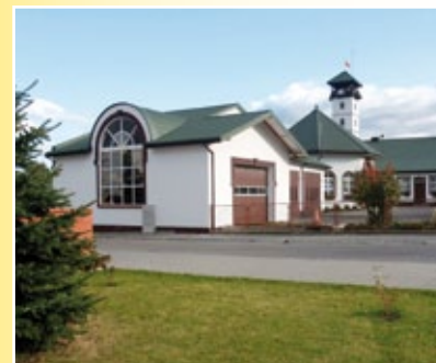
Remiza Miejskiej Ochotniczej Straży Pożarnej w Kowalu