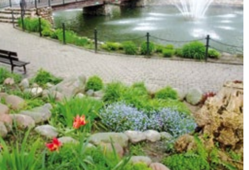
Park im. Leona Stankiewicza

Kowal szczerzy się integrującymi społeczność lokalną organizacjami, a do najważniejszych i naj-