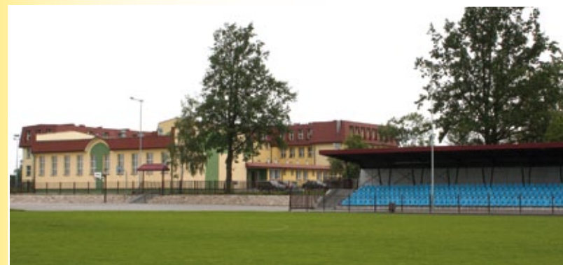
Placówki oświatowe i stadion miejski im. Kazimierza Górskiego w Kowalu