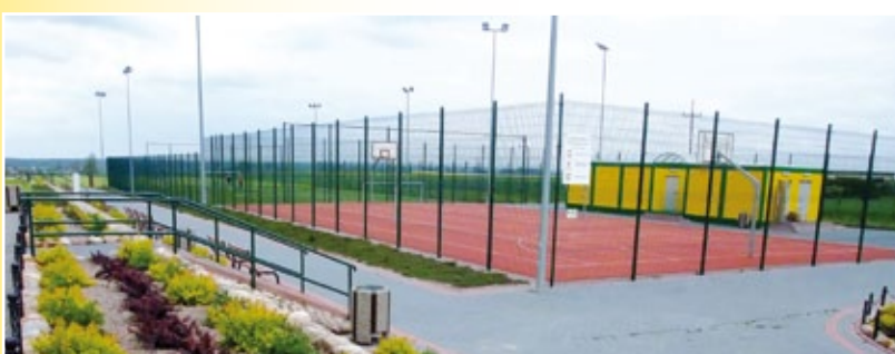
Zespół boisk Orlik