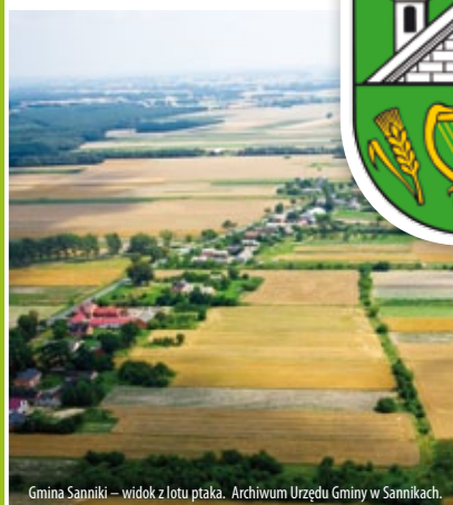
Gmina Sanniki - widok z lotu ptaka.