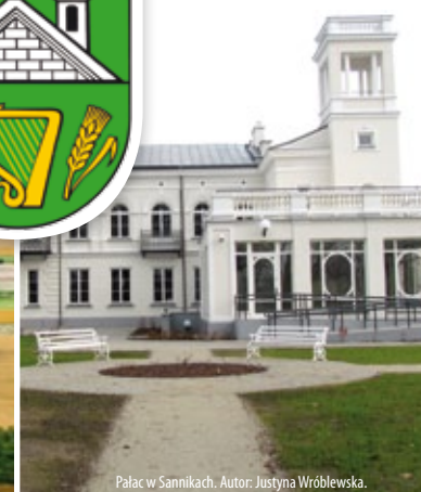
Pałac w Sannikach. Autor: Justyna Wróblewska.