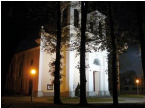
Kościół w Sannikach.

nie cały Zespół Pałacowo-Parkowy im. Fryderyka Chopina w Sannikach poddany został kompleksowej rewaloryzacji z udziałem środków pochodzących z Unii Europejskiej. Całkowita wartość projektu wyniesie około 20 mln zł. Dofinansowanie z Unii Europejskiej to kwota 17 mln zł. W ramach ogromnego przedsięwzięcia na obiekcie Pałacu wykonane zostały prace rozbiórkowe i ziemne, wymieniony dach, stolarka okienna i drzwiowa, a także odbudowana oranżeria. Wykonane zostały również prace elewacyjne budynku oraz prace na terenie parku. Przepalacowy park odzyskał dawny blask, powstały nowe alejki parkowe, nowe nasadzenia krzewów, parkingi oraz tereny rekreacyjno-sportowe, tj. boiska do kometki i tenisa oraz piłki nożnej. Utwardzony został teren przed muszlą koncertową oraz aleja główna, prowadząca od ulicy Warszawskiej do Pałacu, przy której zamontowano nowe oświetlenie. Wewnątrz Pa-