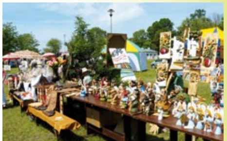
Obchody „Niedzieli Sannickiej”.