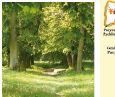
Kamień w parku, na którym zwykł siadać Fryderyk Chopin podczas swojego pobytu w Sannikach.

Gmina Sanniki jest bardzo ciekawym regionem etnograficznym Mazowsza. Region Sannicki to odrębność w tańcu, śpiewie, muzyce i stroju ludowym, co doskonale w swym repertuarze artystycznym prezentuje Regionalny Zespół Pieśni i Tańca „Sanniki” wraz z kapelą ludową. Zespół odnosi liczne sukcesy zdobywając nagrody i wyróżnienia na konkursach i przeglądach twórczości ludowej. Gościł na uznanych festiwalach ludowych w Kazimierzu nad Wisłą i Sierpcu. Koncertował wielokrotnie za granicą, wszędzie wzbudzając aplauz widzów (m.in. w Holandii, Austrii, Francji, Niemczech i Szwajcarii). Pieczę nad Regionalnym