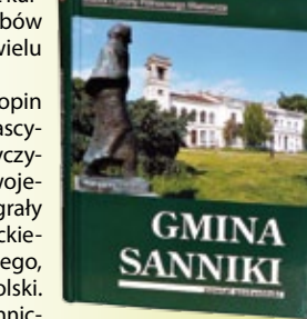
Publikacja albumowo-monograficzna o Gminie Sanniki. Projekt zrealizowany z udziałem środków Osi 4 LEADER (PROW na lata 2007-2013).

się Zespół Pałacowo-Parkowy im. Fryderyka Chopina, który jak sama nazwa wskazuje ma związek z genialnym kompozytorem - Fryderykiem Chopinem. Latem 1828 r. w Sannikach przebywał „dla poratowania zdrowia” młody Fryderyk. Tu stworzył również swoje dzieła, do których inspirację czerpał z kultury ludowej Regionu Sannickiego. Bogactwo zasobów ludowych Regionu Sannickiego da się słyszeć w wielu utworach tego wielkiego kompozytora.