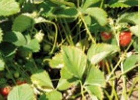
Truskawki - jedna z dominujących upraw na terenie Gminy Sanniki.

W ramach pozyskanych środków zewnętrznych budowane są m.in. drogi gminne, rozbudowana została gminna oczyszczalnia ścieków, zmodernizowany obiekt sportowy, remontowane placówki oświatowe oraz świetlice wiejskie. Gmina Sanniki, jako partner Lokalnej Grupy Działania Fundacji „AKTYWNI RAZEM” realizuje projekty z udziałem środków pochodzących z Osi 4 LEADER (PROW na lata 2007-2013). W ramach tych środków ukazała się m.in. publikacja