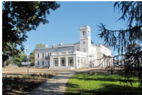
Pałac w Sannikach. Autor: Justyna Wróblewska.

łac odtworzone zostały historyczne malatury pamiętające pobyt Fryderyka Chopina w Sannikach, odkryte podczas prac remontowych. Wykonana została również aranżacja wnętrza Pałacu tak, aby nadać im nowy blask przy zachowaniu historycznego charakteru obiektu. Pomieszczenia zostaną wyposażone w odpowiedni sprzęt, który umożliwi funkcjonowanie w nim jednostki kultury, jaką jest Europejskie Centrum Artystyczne im. Fryderyka Chopina w Sannikach. Wyremontowany