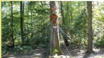
Jedna z kapliczek w moczarskim lesie.