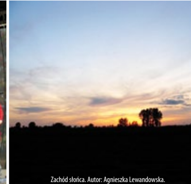
Zachód słońca. Autor: Agnieszka Lewandowska.