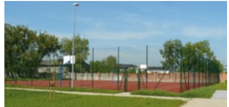
Boiska do kometki i tenisa oraz piłki nożnej na terenie Zespołu Pałacowo-Parkowego im. Fryderyka Chopina w Sannikach.

linia Książąt Mazowieckich, a król Kazimierz Jagiellończyk, któremu obaj książęta złożyli hołd lenny, włączył do Polski pierwsze dzielnice Mazowsza - ziemię rawską i gostyńską (wraz z Sannikami), a niedługo potem sochaczewską. Rozpoczęło się kształtowanie ówczesnego Państwa Polskiego, a Sanniki odegrały ważną rolę w tym wielkim dla historii Polski wydarzeniu. W 2012 r. Gmina Sanniki zwyciężyła w I Turnieju Miast