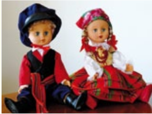
Lalki w oryginalnym stroju ludowym Regionu Sannickiego.

Gmina Sanniki położona jest w centrum Polski, w zachodniej części województwa mazowieckiego (powiat gostyniński). Powierzchnia gminy zajmuje obszar 94,6 km 2 i zamieszkuje ją 6 501 osób. Gminę Sanniki tworzy 18 sołectw: Aleksandrów, Barcik Nowy, Barcik Stary, Brzezia, Brzeziny, Czyżew, Działy, Krubin, Lasek, Lubików, Lwówek, Osmolin, Osmólsk, Sanniki i Moczarzewo, Sielce, Staropól, Szkarada oraz Wólka.