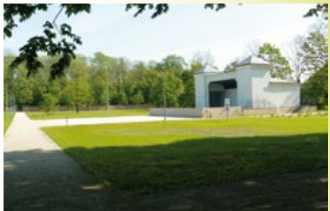
Muszla koncertowa w Zespole Pałacowo-Parkowym im. Fryderyka Chopina w Sannikach.

pamięci narodowej zostały odnowione i zyskały nowy wygląd. Podróżując przez teren Gminy Sanniki napotkać można wiele przydrożnych kapliczek. Często powstały one w podziękowaniu mieszkańców za opiekę i dane łaski. Wiele z nich kryje w sobie wzruszające historie, które mieszkańcy przekazują z pokolenia na pokolenie. Spacerując ścieżkami kompleksu leśnego w Mocarzewie również nie sposób nie zauważyć wielu przepięknych kapliczek. Ukryte wśród drzew, udekorowane potrafią zatrzymać choć na chwilę każdego przechodnia. Na obrzeżach moczarskiego lasu znajduje się także mogiła z okresu II wojny światowej. Najstarsi mieszkańcy opowiadają, iż jest to mogiła ko-