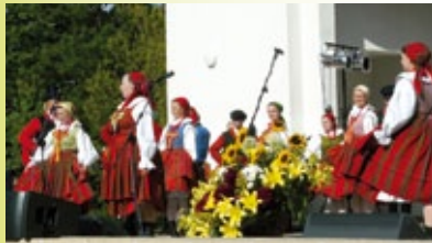
Występ Regionalnego Zespołu Pieśni i Tańca „Sanniki” wraz z kapelą ludową podczas „Niedzieli Sannickiej”.