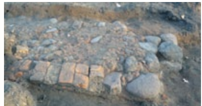
Odkopane fundamenty dawnego dworu, w którym przebywali Książęta Mazowiecy. W jednej z komnat sannickiego dworu zmarł książę rawski, płocki i gostyński - Siemowit VI.

W Sannikach organizowana jest również impreza rycerska „Na dworze Księcia Siemowita VI”. Jest to dzień pełen atrakcji dla najmłodszych, który przenosi w świat średniowiecza i stanowi wyjątkową lekcję historii. Każde dziecko może stać się w tym dniu rycerzem, nauczyć się walczyć mieczem i poznać tajniki rycerskiego fachu, a także wziąć udział w licznych konkursach. Zamiarem jest, aby Festyn Rycerski w Sannikach