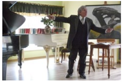
Sannickie koncerty chopinowskie. Wspaniały występ Wojciecha Siemiona.

linia Książąt Mazowieckich, a król Kazimierz Jagiellończyk, któremu obaj książęta złożyli hołd lenny, włączył do Polski pierwsze dzielnice Mazowsza - ziemię rawską i gostyńską (wraz z Sannikami), a niedługo potem sochaczewską. Rozpoczęło się kształtowanie ówczesnego Państwa Polskiego, a Sanniki odegrały ważną rolę w tym wielkim dla historii Polski wydarzeniu. W 2012 r. Gmina Sanniki zwyciężyła w I Turnieju Miast