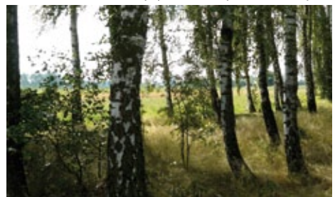
Krajobraz leśny.