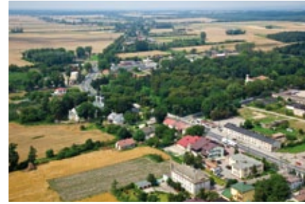
Centrum Sannik. Widok z lotu ptaka.

W bezpośrednim sąsiedztwie położone są gminy: Gąbin, Iłów, Kiernożia, Pacyna