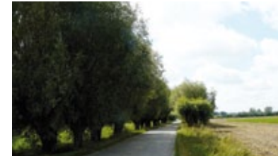
Krajobraz mazowieckiej wsi - wierzby. Archiwum Urzędu Gminy w Sannikach.

Zespołem Pieśni i Tańca „Sanniki” wraz z kapelą ludową sprawuje Gminny Ośrodek Kultury w Sannikach, który jest również głównym animatorem kultury na terenie Gminy Sanniki. Gminny Ośrodek Kultury posiada wielopłaszczyznowe osiągnięcia i należy do czołowych ośrodków upowszechniania kultury na wsi nie tylko na Mazowszu, ale również w całym kraju. Region Sannicki to również twórczość ludowa. To sannickie wycinanki („kłapoki”, „ptaki”, „wesela”). To także pisanki wielkanocne i bukiety z bibulek. Tajniki sannickiej sztuki z pokolenia na pokolenie przekazują twórczy ludowe. Swym zamiłowaniem do spuścizny kulturowej Regionu Sannickiego zarażają młode pokolenia, swoje dzieci i wnuków.