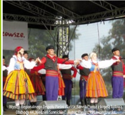
Występ Regionalnego Zespołu Pieśni i Tańca „Sanniki” wraz z kapelą ludową. Obchody 44. „Niedzieli Sannickiej”.