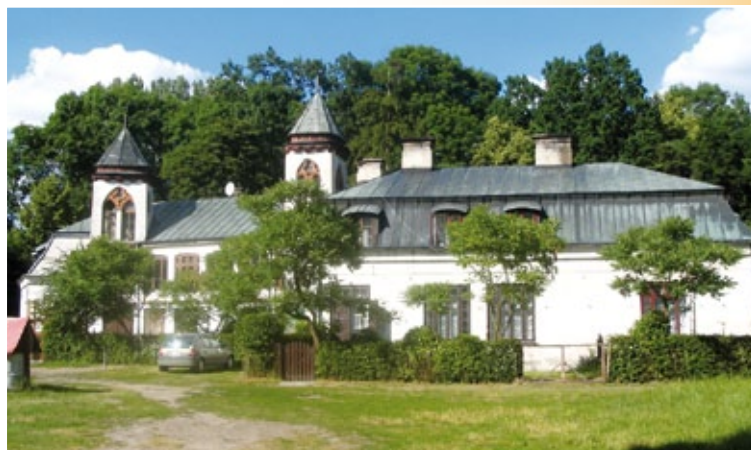
Pałacyk myśliwski w zespole pałacowo - parkowym w Nowym Duninowie