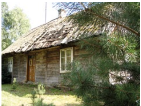
Stara zabudowa w Grodziskach

Cukrownia była jednym z wielu przedsięwzięć rodziny Ike Duninowskich. W 1832 r. dobra duninowskie