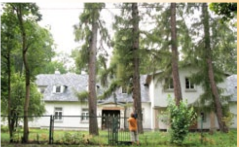
Przebudowywany wielokrotnie dworek Epsteinów otoczony modrzewiami

Neogotycki Kościół pw. Matki Bożej Częstochowskiej powstał w latach 1905 - 1906 (Arch. Cichocki). Wpisany do rejestru zabytków w 1978 roku.