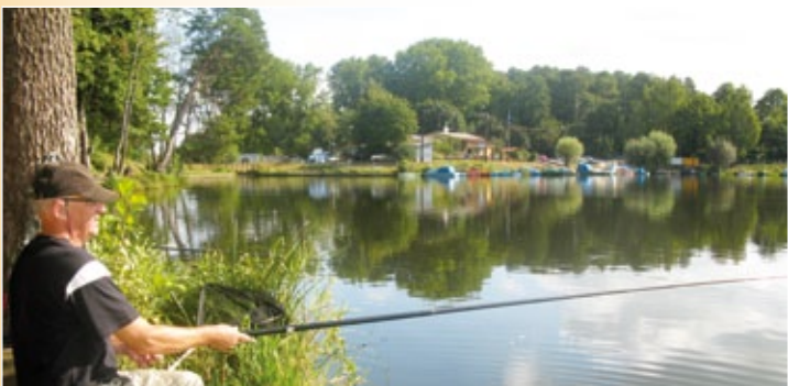
Jezioro Soczewka to raj dla wędkarzy