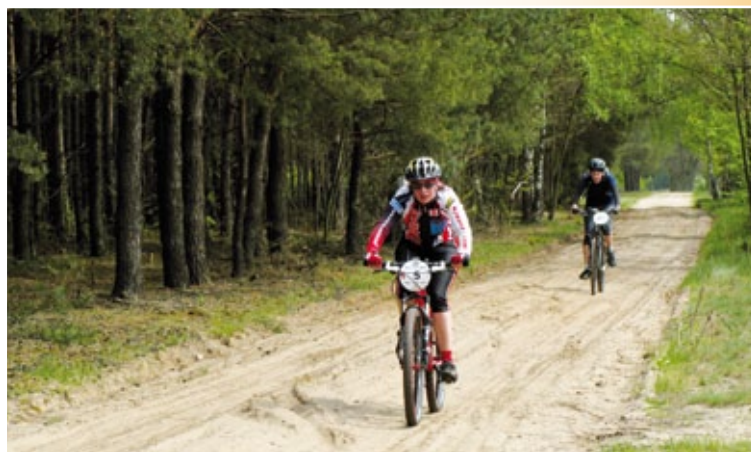
Lasy - naturalne bogactwo gminy