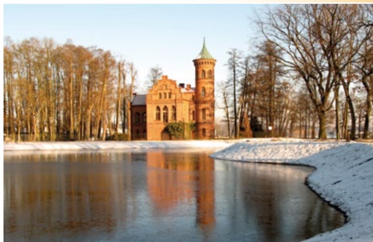
Odbudowane stawy w zabytkowym parku w Nowym Duninowie. W tle zameczek neogotycki