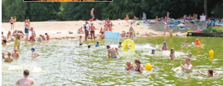
Kąpielisko nad jeziorem Soczewka