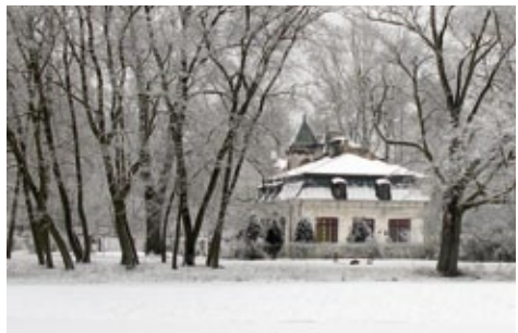
Pałacyk myśliwski w zabytkowym parku w Nowym Duninowie

Głównym akcentem kompozycyjnym parku była aleja wjazdowa obsadzona lipami, od drogi krajowej nr 62,