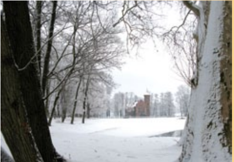
Zabytkowy park w Nowym Duninowie. W tle zameczek neogotycki

Neorenesansowy pałac główny. Powstał w latach 1862-1876. Murowany obiekt z cegły ma dwie kondy-