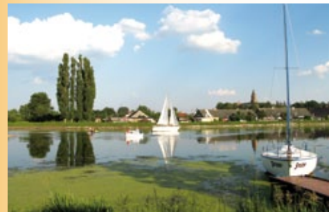
Port w Nowym Duninowie

Zalew Włocławski to największy akwen pod względem powierzchni w Polsce, który daje ogromne możliwości do uprawiania wszelkiego rodzaju sportów wodnych, zwłaszcza żeglarstwa i sportów motorowodnych. Wzdłuż akwenu w miejscowości Nowy Duninów rozmieszczone są wypożyczalnie sprzętu wodnego oraz przystanie wodne. Coraz większą popularnością cieszą się organizowane corocznie Regaty Żeglarskie, które od roku 2004 są jedną z 5 imprez GARND PRIX Zalewu Włocławskiego.