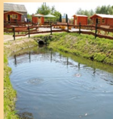
Komercyjne łowisko w Woli Brwileńskiej

„Cezarus” Gospoda w Soczewce ul. Spacerowa 1 Soczewka tel. 24 231 22 90