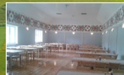
Świetlica wiejska w Rakutowie

Podgrodzie Przydatki Gołaszewskie 3 87-820 Kowal tel.: 54 284 25 01 e-mail: hotel@podgrodzie.com.pl www.podgrodzie.com.pl