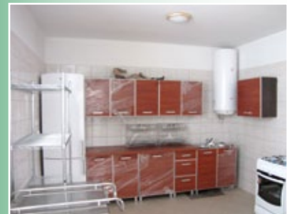
Świetlica w Grodztwie