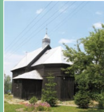
Drewniany kościółek w Nakonowie

Zabytkowy murowany kościół parafialny p.w. św. Marii Magdaleny w Grabkowie. Kościół został pierwotnie wzniesiony w II połowie XV w., przebudowany w 1889 r. w stylu eklektycznym. Obiekt wpisany do rejestru zabytków w 1982 roku.