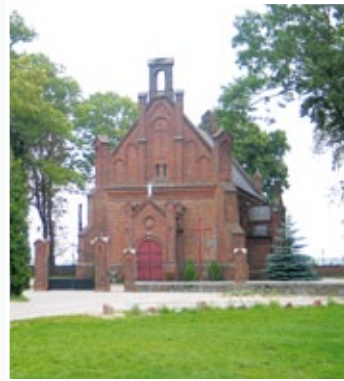
Kościół w Grabkowie

Zabytkowa dzwonnica, znajdująca się przy kościele w Grabkowie, powstała w końcu XIX wieku wraz z murowanym ogrodzeniem kościoła, starodrzewem okalającym kościół, plebanią oraz figurą Chrystusa.