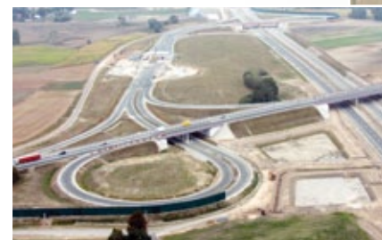
Węzeł Kowal w miejscowości Dąbrówka

Wychodząc naprzeciw przyszłym inwestorom, samorząd gminy jest w trakcie opracowywania planu zagospodarowania przestrzennego, który obejmuje ok. 200 ha w miejscowościach przyległych do węzła autostradowego KOWAL oraz drogi krajowej nr 1. Tereny te są położone również w bezpośrednim sąsiedztwie drogi wojewódzkiej i powiatowej.