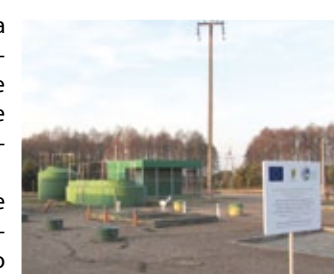
Oczyszczalnia ścieków w Gołaszewie