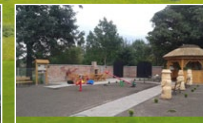
Kąpielisko przy świetlicy wiejskiej w Rakutowie