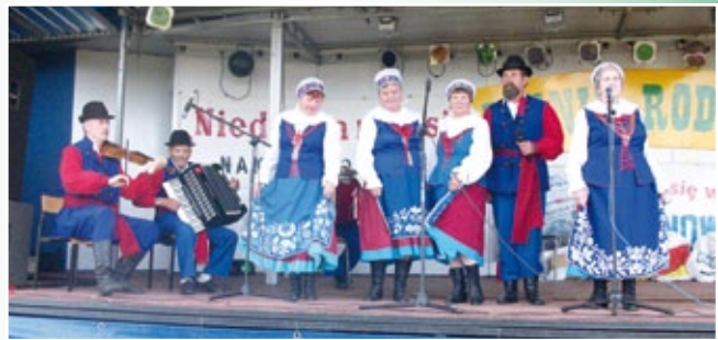
Kapela Spod Kowala podczas festynu „Niedziela na Wsi”

Na terenie Gminy Kowal prężnie działa KAPELA SPOD KOWALA, założona w 1968 roku. Jest ona jedną z najstarszych amatorskich kapel w Polsce, a najstarszą na Kujawach. Kapela gra i śpiewa dawne melodie regionalne, zachowując ich autentyczną formę.