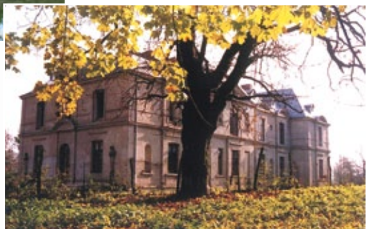
Pałac w Więslawicach

Pałac w Więslawicach został wzniesiony w latach 1880 - 90, przebudowano go w 1910 r. Pałac zbudowany jest w stylu eklektycznym, dwukondygnacyjny, murowany, kryty dachem z blachy cynkowej.