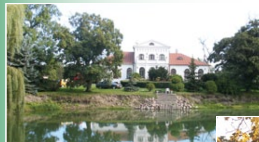
Dworek w Unisławicach

Pałac w Więslawicach został wzniesiony w latach 1880 - 90, przebudowano go w 1910 r. Pałac zbudowany jest w stylu eklektycznym, dwukondygnacyjny, murowany, kryty dachem z blachy cynkowej.