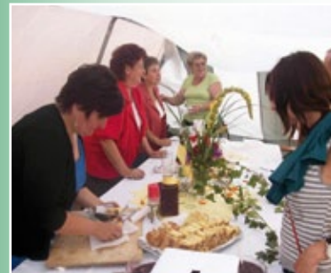
Kobiety z KGW podczas festynu „Niedziela na Wsi”

Funkcjonuje tutaj 14 Kół Gospodyń Wiejskich, skupiających około 150 osób. Panie aktywnie włączają się w życie społeczne i kulturalne gminy. Organizują Dzień Babci i Dziadka, Dzień Kobiet, Dzień Matki - połączone z występami lokalnych zespołów muzycznych oraz Dzień Dziecka - z przepysznyimi wypiekami dla najmłodszych.