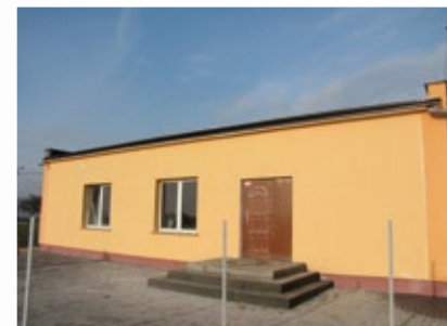
Świetlica w Dziardonicach