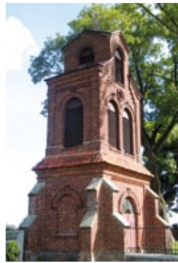
Dzwonnica w Grabkowie