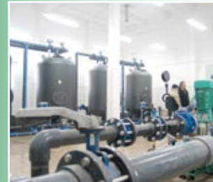
Ujęcie wody w Grabkowie

Gmina Kowal posiada dobrze rozwiniętą infrastrukturę techniczną, na którą składa się: