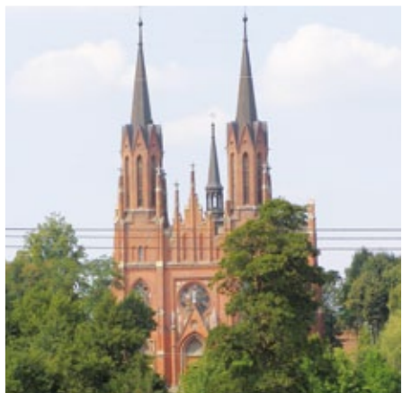
Neogotycki Kościół w Białotarsku

Północną część gminy zajmuje Gostynińsko – Włocławski Park Krajobrazowy zwany często Zielonymi Płucami Mazowsza, dla którego szczególnie charakterystyczne są wydmy, ozy, kemy i rynny połodowcowe. W wyjątkowo cennych fragmentach Parku, ze względu na występowanie zespołów roślinnych, gatunków chronionych i osobliwości florystycznych, utworzono rezerwat przyrody: Doliny Skrwycy (krajobrazowo-leśny), Komory (jeziorowo-leśny), Lubaty (jeziorowo-leśny), Lucień (jeziorowo-leśny), Oset-