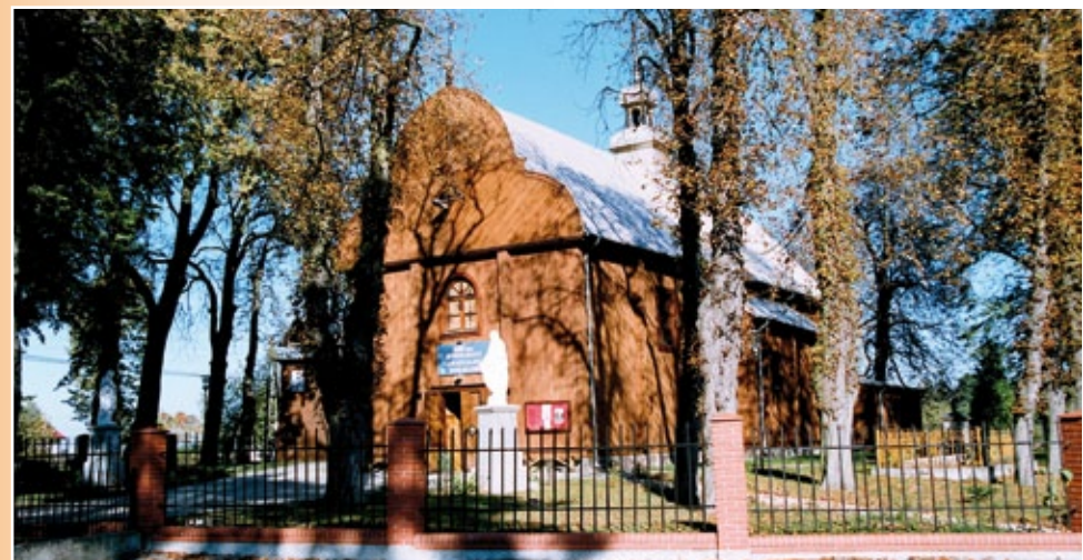
Drewniany Kościół w Sierakówku

Gmina Gostynin to miejsce atrakcyjne turystycznie, zarówno pod względem przyrodniczym, historycznym, jak również kulturowym.