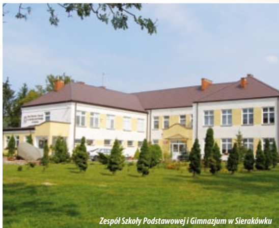
Zespół Szkół Podstawowej i Gimnazjum w Sierakówku

i Łokietnica, wchodzących w skład Szczawina Kościelnego. Jej łączna powierzchnia wynosiła wówczas 14,4 km 2 . Kolejnym etapem było połączenie gminy Gostynin z gminą Rataje i miastem Gostynin oraz utworzenie wspólnej jednostki administracyjnej Miasto i Gmina Gostynin. W dniu 1 stycznia 1992 r. nastąpiło odłączenie gminy od miasta. Po reformie administracyjnej w 1998 roku gmina weszła w skład powiatu gostynińskiego, a ten do województwa mazowieckiego. Gmina Gostynin charakteryzuje się pięknym krajobrazem, poprzecinana