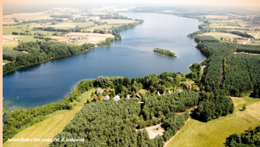
Jezioro Białe z lotu ptaka