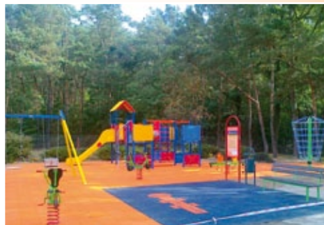
Plac zabaw przy Szkole Podstawowej w Teodorowie