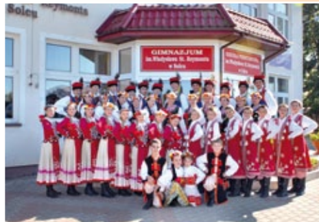
Dziecięcy Zespół Pieśni i Tańca SOLEC

nie odbudowane w Sierakówku i Osinach. Warto wspomnieć również o miejscach pamięci narodowej. Należy w tym miejscu wymienić Gašno i Teodorów – pomniki Powstańców z 1863 roku.