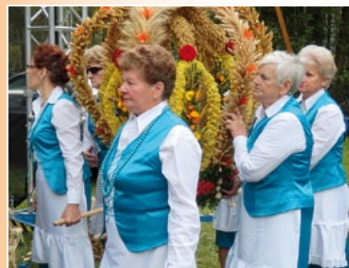
IV Gminne Dożynki Ekologiczne w Emilianowie

Czyste i zagospodarowane turystycznie jeziora: Białe, Sumino, Lucieńskie przyciągają