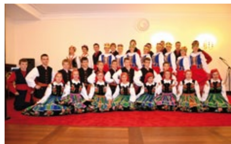
Zespół Pieśni i Tańca PROMYKI LUCIENIA