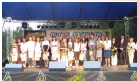
Zakończenie Pleneru „U Wójta”