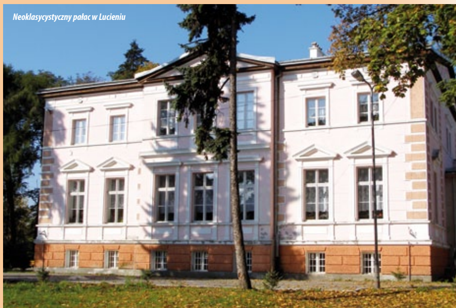
Neoklasycystyczny pałac w Lucieniu

Gostynin is regarded as a place of great investment potential. It is an exceptional corner of Poland which is well worth seeing.