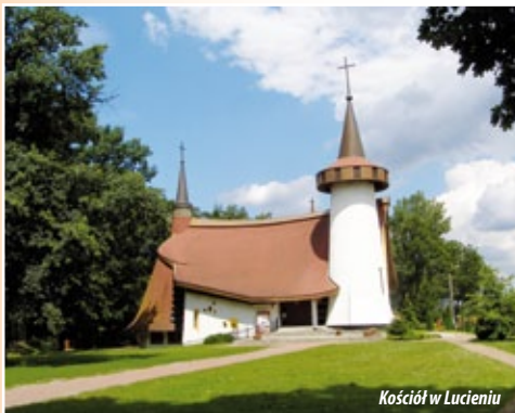
Kościół w Lucieniu

Gmina Gostynin leży w samym sercu Polski, w odległości 120 km od Warszawy oraz ok. 90 km od Łodzi i jest jedną z największych gmin na Mazowszu. Łączny obszar gminy liczy prawie 271 km 2 , a na jej terenie mieszka ponad 12 tysięcy mieszkańców. Gmina Gostynin dzieli się na 56 sołectw, które są jej jednostkami pomocniczymi. Okala miasto Gostynin i graniczy z gminami: Nowy Duninów, Łąck, Szczawin Kościelny, Strzelce, Łanięta, Baruchowo oraz Lubień Kujawski.