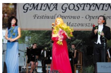
Gala Operowo - Operetkowa w Lucieniu

Z zabytkowych siedzib szlacheckich do naszych czasów przetrwały dwory: barokowy w Sokołowie, klasycystyczny z połowy XIX w. w Lucieniu, również z połowy XIX w. w Skrzanach i pięk-