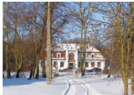
Odreštaurowany dwór w Sierakówku

w sezonie letnim rzesze mieszkańców i turystów, którzy mogą wypoczywać w malowniczo usytuowanych gospodarstwach agroturystycznych.