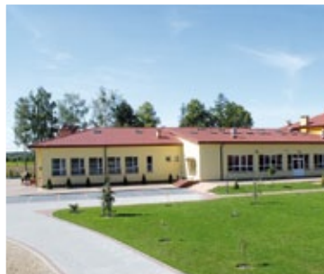
Budynek Zielonej Szkoły po przeprowadzonym remoncie