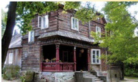
Dwór w Czarnem