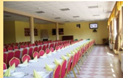
Sala bankietowa znajdująca się w Zielonej Szkole