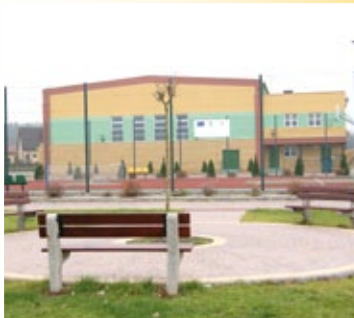
Zagospodarowany teren w sąsiedztwie kompleksu sportowo-rekreacyjnego