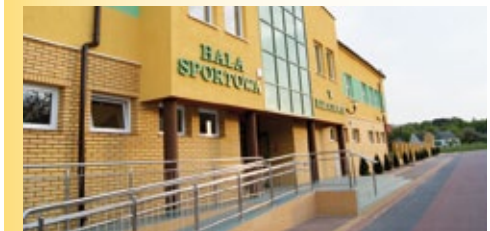
Hala Sportowa w Baruchowie

du całoroczną kolejką turystyczną. Z myślą o najmłodszych miłośnikach motoryzacji został uruchomiony tor gokartowy, wyposażony w 6 pojazdów o napędzie elektrycznym. W centrum gminy, w miejscowości Baruchowo