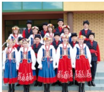
Stroje kujawskie zakupione dla Zespołu SWOJACY