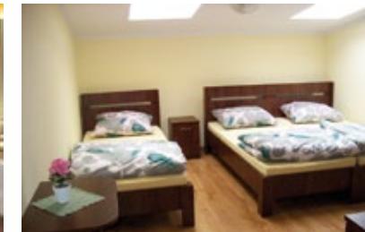
Pokoje do wynajęcia w Zielonej Szkole w Goreniu Dużym