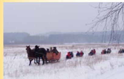
Kulig - jedna z wielu atrakcji, którą oferuje Zielona Szkoła