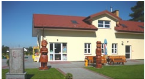
Ośrodek dydaktyczno-rekreacyjny znajdujący się przy Zielonej Szkole

kim: Bór, Bóbr, Orzeł. Amatorów odpoczynku przy wędkach z pewnością przyciągnie możliwość złowienia w naszych jeziorach karasia, szczupaka, karpia, amura, lina.