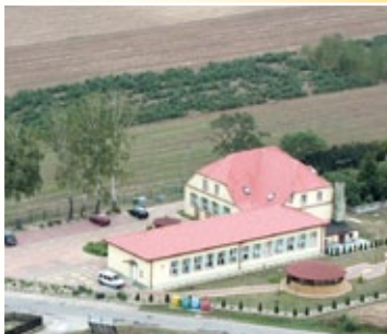
Kąpielisko rekreacyjny przy Świetlicy Wiejskiej w Czarnem