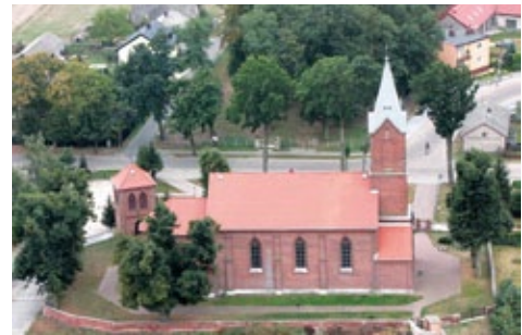
Kościół murowany neogotycki z 1881 r. p.w. Świętej Trójcy z dzwonnica w Kłótnie