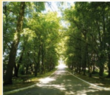
Aleja lipowa w Baruchowie