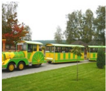
Kolejka turystyczna z dwoma wagonikami - atrakcja Zielonej Szkoły w Gorenium Dużym