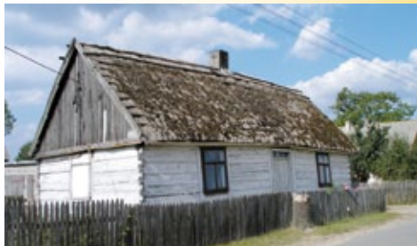
Zabytkowy wiejski dom z końca XIX w.

- zespół parkowo - dworski w Czarnem z dworem pobudowanym ok. 1870 r. składający się z trzech budynków wzniesionych w różnym czasie, połączonych w jedną bryłę. Wokół znajduje się park krajobrazowy z luźnymi skupiskami starodrzewu z grupą modrzewi, jaworów i brzoź.