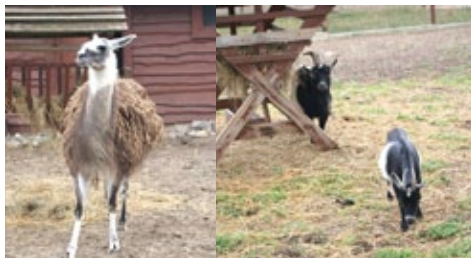
Mini zoo w Zielonej Szkole

Niebywałą atrakcją na terenie Gminy Baruchowo jest funkcjonująca od 2000 roku Zielona Szkoła w Goreniu Dużym, położona 25 km od Włocławka, 40 km od Płocka. Jest to placówka, która wszystkim chętnym, przez cały rok, zapewnia wypoczynek i rekreację przyrodniczą. Ponadto Zielona Szkoła oferuje możliwość wynaję-