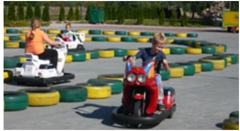
Tor gokartowy - nie lada gratka dla najmłodszych

cia pokoi wieloosobowych oraz pokoi 2 - 4 osobowych z łazienkami oraz w pełni wyposażonym aneksem kuchennym. Do dyspozycji gości jest miejsce do grillowania, palenisko przygotowane pod ognisko, plac zabaw, 20 rowerów z możliwością wypożyczenia oraz boisko do piłki siatkowej i piłki nożnej, a także możliwość przejeżdżania na kolarstwie. W tym celu została zorganizowana baza turystyczna z miejscami noclegowymi. Najbardziej odwiedzanymi akwenami wodnymi podczas okresu letniego jest Jezioro Skrzyneckie, Jezioro Goren i Jezioro Czarne. Na uwagę zasługują również inne mniejsze jeziora: Jezioro Kurowskie, Trzebowskie i Grodzieńskie oraz naturalne drobne oczka wodne w zagłębieniach wytopiskowych, mokradła, bagna i trzęświiska. Miejscowości leżące nad tymi jeziorami wyspecjalizowały się w zakresie turystyki pieszej, konnej i rowerowej, a także turystyki przyrodniczej. Przez najatrakcyjniejsze tereny gminy biegnie szereg szlaków turystycznych. Stworzone są również znakomite warunki dla miłośników polowania, dzięki istniejącym kołom łowiecz-