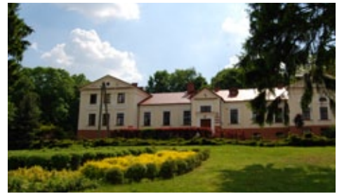
Dwór w Czarnem

Aby zachować niezmienną przyrodę na terenie Gminy Baruchowo utworzono różne formy ochrony przyrody. Wśród nich rezerwat leśny „Olszyny Rakutowskie”, rezerwat leśno - jeziorny Grodno, Obszary Natura 2000 oraz liczne pomniki przyrody rozproszone po całym jej terytorium. Ponad 60 % terenu Gminy Baruchowo leży w granicach Gostynińsko - Włocławskiego Parku Krajobrazowego ukazując występujące tu rzadkie rośliny i zwierzęta w skali regionu, a nawet kraju.